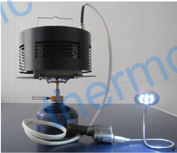
把发电机直接放在火炉上即可提供电力。