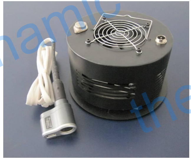
8W 直燃式发电机实物图（汽车点烟适配器接线，输出 12V 和 USB 5V 直流电）